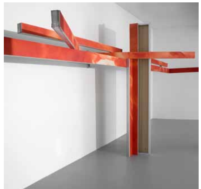
Sketch (n°13, grande esquisse rouge), 2012 Encre sur Placoplatre 250 x 1500 x 130 cm

L'œuvre de Jézéquel a éminemment à voir avec l'art minimal de ses aînés mais au regard d'un certain nombre de notions comme la fragilité, l'instabilité, la tension, l'écart, le passage. Si elle revendique le concept de « forme ouverte », c'est parce que l'idée de fragment lui importe pour ce que « le travail de l'art, c'est inclure la déconstruction, plutôt qu'un travail positif d'affirmation ».