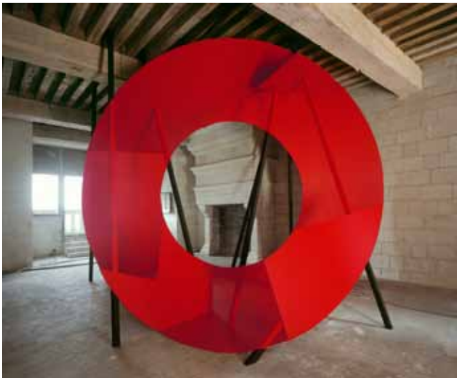
Georges Rousse, Château de Chambord, 2012